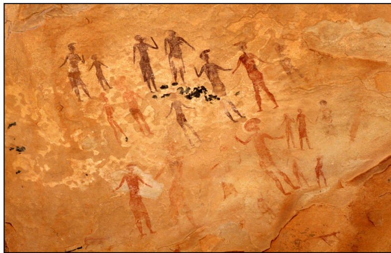
Felsmalerei im Tassili n'Ajjer (Algerien)