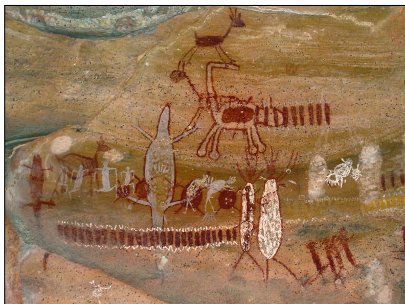
Höhlenmalerei in Serra da Capivara National Park, Brasilien