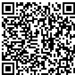
Die polyglotte Katze (Heinz Erhardt)