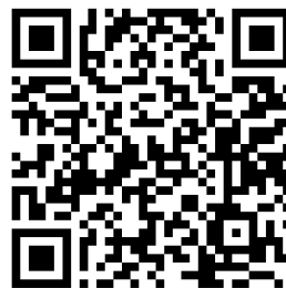
Der Spatz - Heinz Erhardt