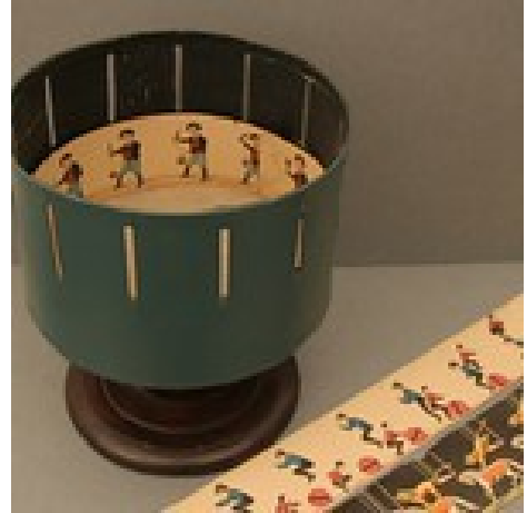
Zoetrop und Papierstreifen

Das Zoetrop ist ein einfaches optisches Gerät, ein Vorläufer des Kinos. Auf mechanischem Weg werden bewegte Bilder erzeugt. Die Geschwindigkeit der Drehbewegung lässt die vielen Öffnungen wie eine einzige, durch die hindurch man die sich bewegenden Figuren sehen kann, erscheinen.