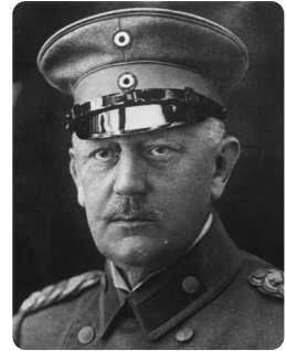
Helmuth Johannes Ludwig von Moltke 1914

③ Warum wollte man gerade Verdun einnehmen?