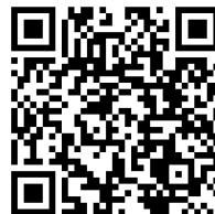
Video 3 - Vorbereitung zu nächster Woche