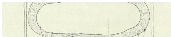
Image from page 821 of „Handbuch der Physiologie des Menschen“ (1909)

Beschreibe alle Teile der Pflanzenzelle, die du im unteren Bild erkennen kannst. Zeichne dafür das Bild in dein Heft und beschrifte die Zellteile mit Pfeilen, die auf die jeweiligen Bestandteile weisen.