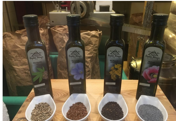
Ölmühle Krauth, Illingen

überwiegend langkettige ungesättigte oder kurzkettige Fettsäuren