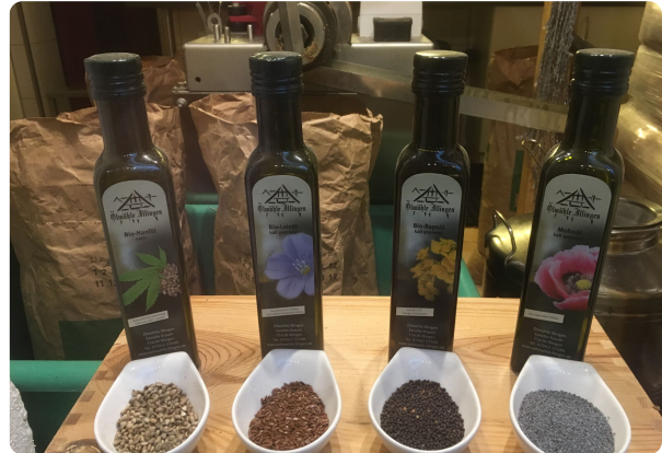
Ölmühle Krauth, Illingen

überwiegend langkettige ungesättigte oder kurzkettige Fettsäuren