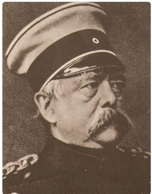
Otto von Bismarck