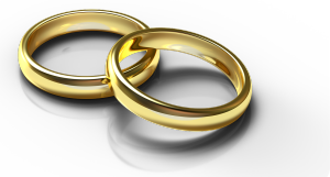
Goldring und Messingring

⑥ Entwickle ein Experiment um zu überprüfen, ob ein Schmuckstück aus teurem Gold, oder einfachem Messig hergestellt wurde.