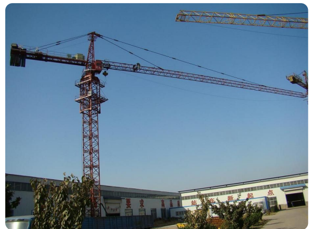
Abb. 2 — Tower Cranes