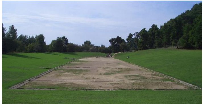
M1: ehemaliges Stadion von Olympia im Jahr 2004

Jede_r von euch hat sicher schon einmal von den Olympischen Spielen gehört. Das ist ein Sportereignis, an dem SportlerInnen aus der ganzen Welt teilnehmen und sich in verschiedenen Disziplinen messen. Die Olympischen Spiele haben eine sehr lange Geschichte. Ihre Wurzeln führen zurück in das antike Griechenland.