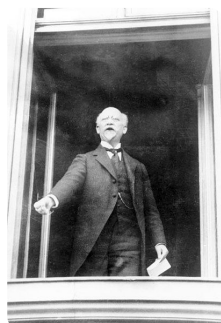
Bild: Philipp Scheidemann in der Reichskanzlei

9. November 1918: Ausrufung der Republik in Berlin