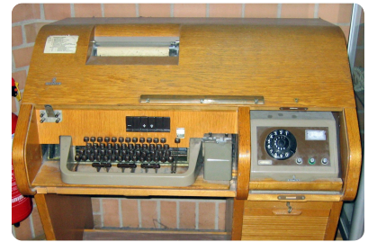
Fernsprecher: Siemens T100 Telex