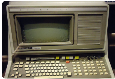
ein alter Terminal-Computer