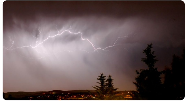
Ein Blitz in den Wolken

Blitze sind ein beeindruckendes Naturschauspiel. Sie entstehen durch elektrische Aufladung in Gewitterwolken. Aber auch aus unserem Alltag ist Elektrizität nicht wegzudenken. Lampen, Computer, Smartphones, Wasserkocher, Mikrowellenherde und zukünftig auch Autos werden mit elektrischem Strom betrieben. Auch Mikrochips - die