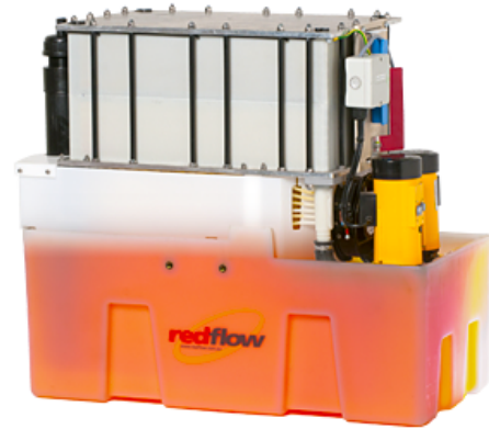
Kompakte RedFlow -Batterie

Die Redox-Flow-Batterie ist eine spezielle Ausführung eines Akkumulators bei dem die Energie in Form von gelösten Ionen gespeichert ist. Zwei verschiedene energiespeichernde Elektrolyte zirkulieren in getrennten Kreisläufen, die zu einer galvanischen Zelle führen, in der die Elektronenauf- bzw. -abnahme und ein Ionenausgleich erfolgt.