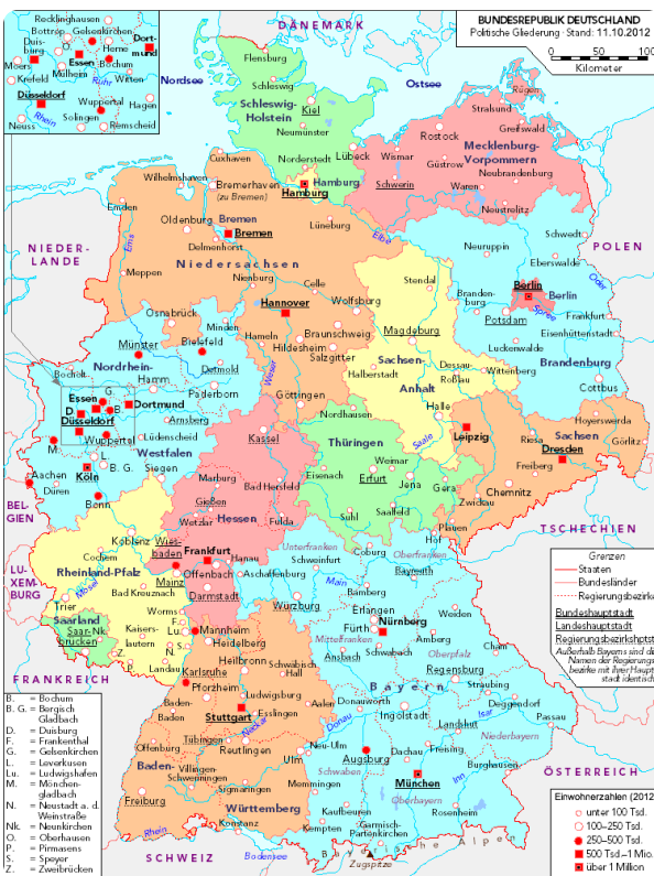
Deutschland politisch 2010

Schaut euch jetzt erst die Karten genauer an. Welche Länder Kantone kanntet ihr nicht? Kennt ihr auch die Hauptstädte der Länder in D? Was wollt ihr noch besser kennenlernen? Was denkt ihr: In welchem Kantonen in CH wird wohl Deutsch/Schwyzerdütsch gesprochen? Und welche Sprachen in den andren Kantonen?