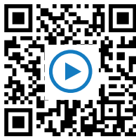
M7: Erklärvideo TheSimpleClub https://t1p.de/TheSC