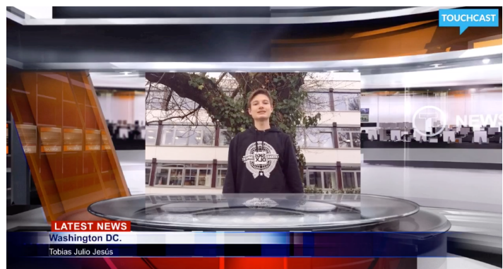
Beispiel aus einem Schülervideo