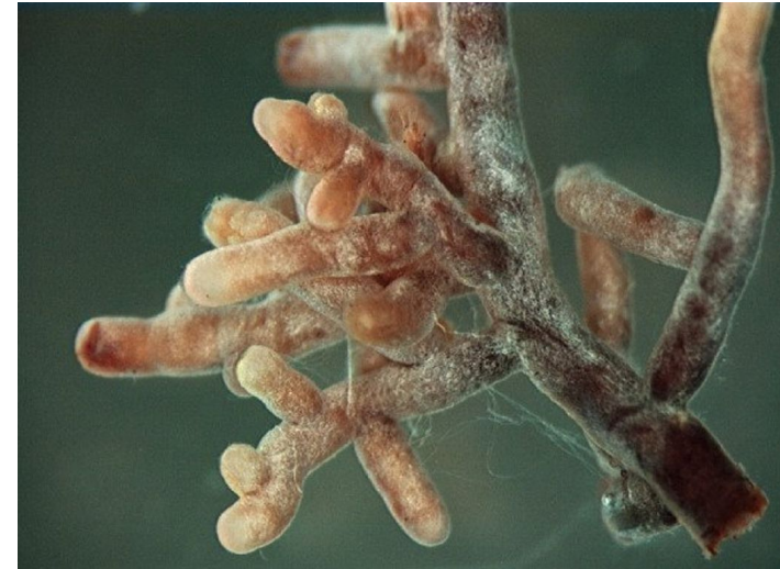
Wurzelspitzen mit Ektomykorrhiza mit einer Amanita-Pilzart

Die Mykorrhiza ist ein Organ, in welchem – wie bei einer Handelsbörse – Stoffe zwischen Baum und Mykorrhizapilz ausgetauscht werden. Während der Baum das Photosyntheseprodukt Zucker an den Mykorrhizapilz abgibt, erhält er von diesem im Gegenzug verschiedene Nährstoffe wie Stickstoff (chem. Zeichen „N“) und Phosphor (chemisches Zeichen „P“), welche der Pilz mit den feinen Pilzfäden aus den kleinsten Bodenporen aufgenommen hat. Weiterhin hemmen Mykorrhiza z.B. die Aufnahme von Schwermetallen und bieten dadurch dem Baum Schutz vor solchen Schadstoffen. Durch Schadstoffe, die stark auf den Pilz einwirken, kann es auch zu einer anhaltenden Schwächung der Bäume kommen. Für einige Baumarten ist die Mykorrhiza unter natürlichen Bedingungen zur normalen Entwicklung notwendig.