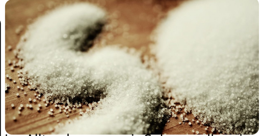
Im Alltag kennen wir Salz vor allem in der Form von Kochsalz, also Natriumchlorid (NaCl).

Reagieren Natrium und Chlor miteinander, so bildet sich eine sogenannte Ionenbindung heraus. Dabei gibt der eine Reaktionspartner (hier: Natrium) seine Außenelektronen ab und der andere (hier: Chlor) füllt mit diesen Elektronen seine äußerste Schale (Abbildung rechts). Dadurch erhalten beide eine Edelgas-konfiguration, werden aber zu Ionen. Das Natrium ist dann positiv geladen, also ein Kation, das Chlor negativ, also ein Anion. Die beiden Reaktionspartner werden durch die elektri-