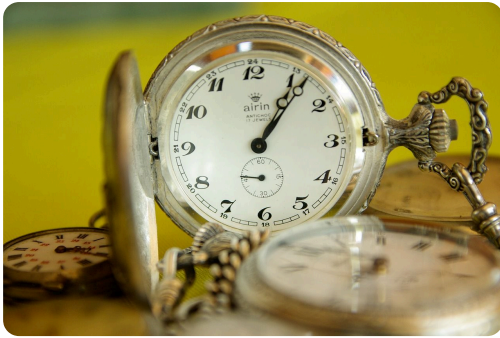
Reloj de bolsillo