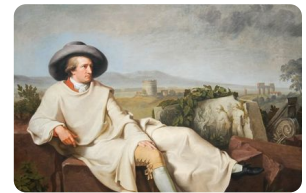
Goethe in der römischen Campagna

M A K R O M O L E K Ü L J Z A Ü H K Z W W B X Q E J I X F B X A X W J K E K Ä I Q N V Q L I Q Z E X J M W A G F Q E T Y E X A E J Q B H Q L P Z E Z Y E S D L T E Ü H T Q K E W B S B N T V F H G W V X W A F A Ö B B Ü E W M E Ü V I M Z N S L Ö R S V R H Ü R P O L Y V I N Y L C H L O R I D Z Q P P O L Y P R O P Y L E N Ü S K V G Y Q K T Ü B T A F G I R W Y L P O L Y E T H Y L E N H P U A O T H E R M O P L A S T W A D J R R K B R V W R P Z M Z Y V A Ö K D U R O P L A S T G Z P V