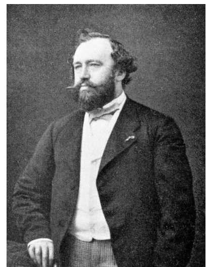
Adolphe Sax

③ Schreiben Sie ein Musikinstrument heraus, welches Adolphe Sax erfunden hat. Welche Musikinstrumente in dieser Wortwolke haben die gleiche Endung?