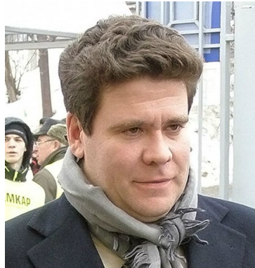
Denis Mazujew

④ 4. Schreiben Sie ein Musikinstrument heraus, welches der berühmte russische Musiker Denis Mazujew spielt.