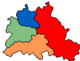
Berlin - Besatzungszonen