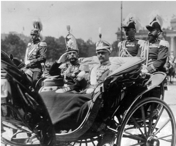
Abb. 1 — Kaiser Wilhelm II und Zar Nicholas II

Internetquelle: https://de.wikipedia.org/wiki/Russisches_Kaiserreich (abgerufen am 12.09.2018 um 19:46 Uhr).