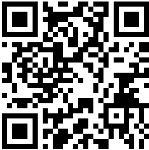
Mebis Tagung 2018