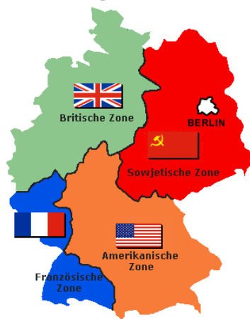
Die Besatzungszonen in Deutschland