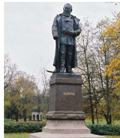
Q3 Carl-Heine-Denkmal in Leipzig

💡 M9: Hier geht's zum Denkmal https://t1p.de/heinedenkmal