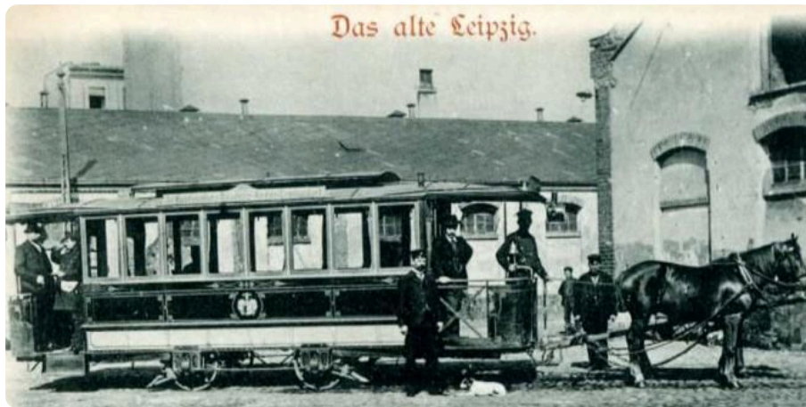
Q5: Das alte Leipzig Foto: Photogr. H. Pechlöffel 1899

Mit der Straßenbahn durch Leipzig zu fahren ist heute ganz normal. Doch das war nicht immer so. Am 18. Mai 1872 begann mit der Eröffnung des Linienbetriebs der Leipziger Pferde-Eisenbahn die Geschichte der Straßenbahn in Leipzig. Das Bild Q4 zeigt dir, wie die Pferdestraßenbahn ausgesehen hat.