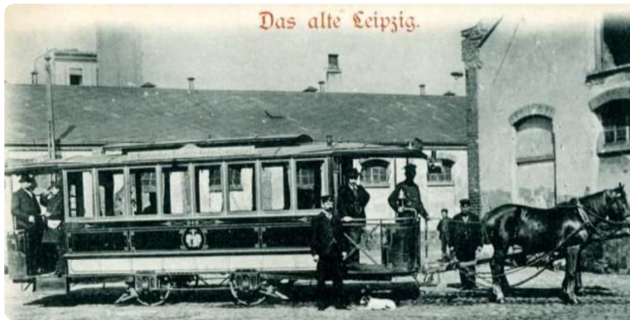
Q5: Das alte Leipzig Foto: Photogr. H. Pechlöffel 1899

Mit der Straßenbahn durch Leipzig zu fahren ist heute ganz normal. Doch das war nicht immer so. Am 18. Mai 1872 begann mit der Eröffnung des Linienbetriebs der Leipziger Pferde-Eisenbahn die Geschichte der Straßenbahn in Leipzig. Das Bild Q4 zeigt dir, wie die Pferdestraßenbahn ausgesehen hat.