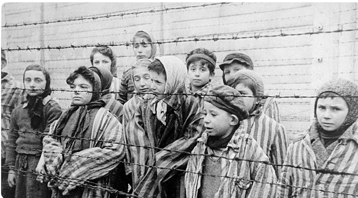
Überlebende Kinder bei der Befreiung des KZ Auschwitz durch die Rote Armee 27.1.1945