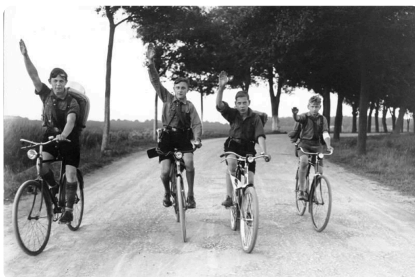
Hitlerjugend bei Fahrradausflug 1932, Bild:Unknown Author, Bundesarchiv, CC-BY-SA 3.0, https://t1p.de/9fo9

M2 Zeitzeugeninterview: https://t1p.de/zeitzeugehitlerjugend