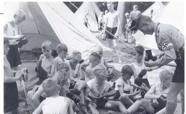
HJ im Ferien-Zeltlager Espohl bei Lemförde zwischen 1933 und 1943, Bild: Unbekannter Fotograf, veröffentlicht von Meinhard Fenske, aus Hosenmatz und Schürzenliese : Kindheitsporträts aus den 30er Jahren in Ostwestfalen-Lippe, Gemeinfrei, https://t1p.de/py7j