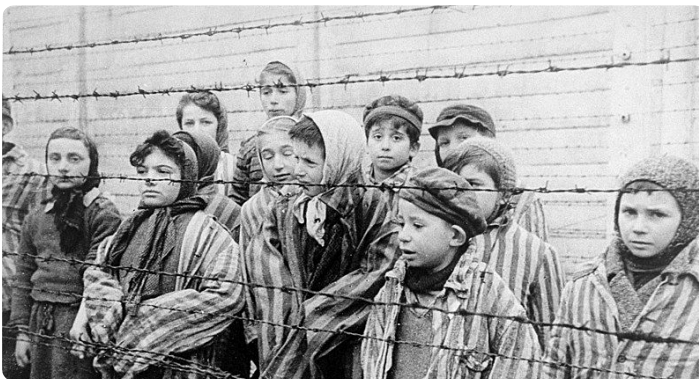
Überlebende Kinder bei der Befreiung des KZ Auschwitz durch die Rote Armee 27.1.1945