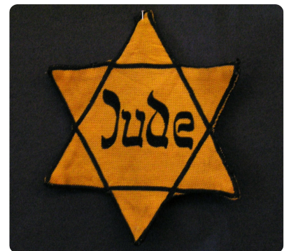
M5 Judenstern 8.2.2005

(2) Weitergehende polizeiliche Sicherungsmaßnahmen sowie Strafvorschriften, nach denen eine höhere Strafe verwirkt ist, bleiben unberührt.