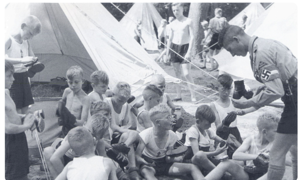
HJ im Ferien-Zeltlager Espohl bei Lemförde zwischen 1933 und 1943, Bild: Unbekannter Fotograf, veröffentlicht von Meinhard Fenske, aus Hosenmatz und Schürzenliese : Kindheitsporträts aus den 30er Jahren in Ostwestfalen-Lippe, Gemein frei, https://t1p.de/py7j