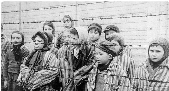
Überlebende Kinder bei der Befreiung des KZ Auschwitz durch die Rote Armee 27.1.1945