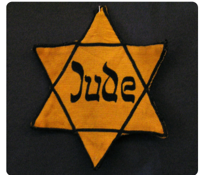
M5 Judenstern 8.2.2005, Bild: Daniel Ullrich, Jüdisches Museum Westfalen, Wikimedia CC-BY-SA 2.0, https://t1p.de/wqnh

(2) Weitergehende polizeiliche Sicherungsmaßnahmen sowie Strafvorschriften, nach denen eine höhere Strafe verwirkt ist, bleiben unberührt.