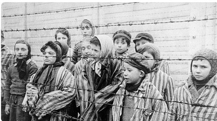
Überlebende Kinder bei der Befreiung des KZ Auschwitz durch die Rote Armee 27.1.1945