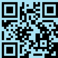
Q2 Brief https://t1p.de/i3u8x