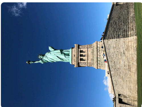
Die Freiheitsstatue auf Liberty Island 2019