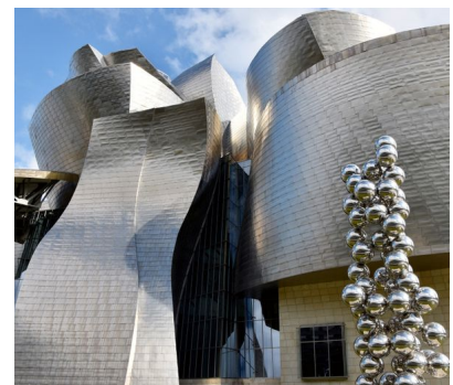
Guggenheim-Museum Bilbao von Roger Canals ist lizenziert unter CC0 1.0