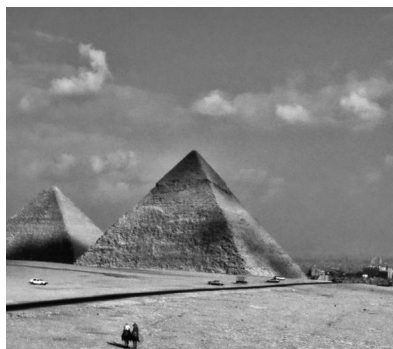
Pyramide von Gizeh