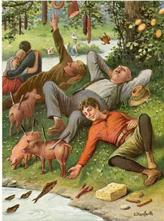
Autor: Oskar Herrfurth