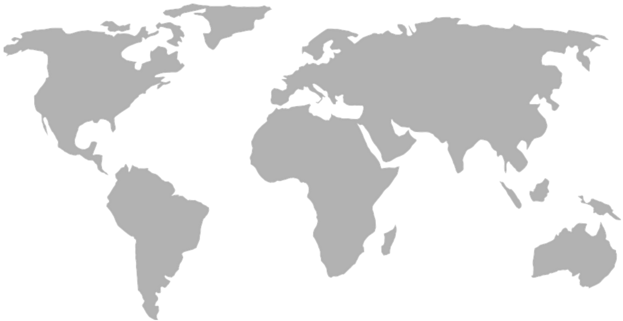
Abb. 2: Weltkarte