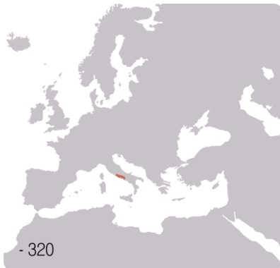
M14: Römisches Reich 320 v. Chr.