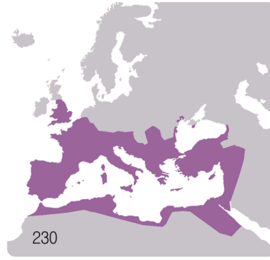
M15: Römisches Reich 230 n. Chr.