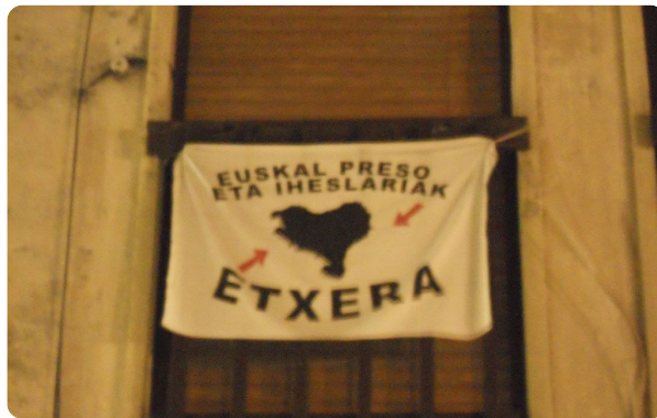
Ejemplo de la lengua vasca

⑧ Aquí encuentras un ejemplo de la lengua vasca. ¿Entiendes algo? ¿Qué crees de qué se trata? Búscala traducción en internet y escríbela abajo (en alemán y español).