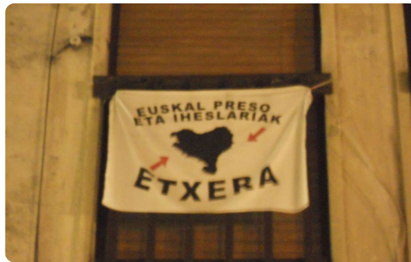
Ejemplo de la lengua vasca

⑧ Aquí encuentras un ejemplo de la lengua vasca. ¿Entiendes algo? ¿Qué crees de qué se trata? Búscala traducción en internet y escríbela abajo (en alemán y español).