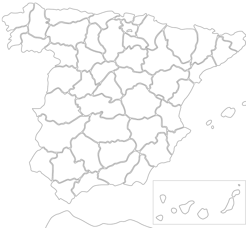
Mapa de España

⑥ ¿Dónde está el País Vasco en el mapa? Si no lo sabes, búscalo en internet. Después, márcalo en el mapa.