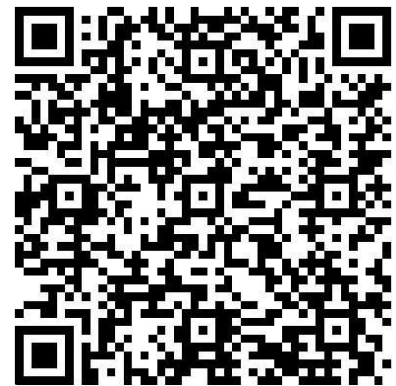
Radiosendung: Wozu brauchen wir Globalgeschichte?

pp Arbeitsaufträge/ pp Lesen Sie den oben stehenden Text der Uni Wien und unterstreichen Sie u fünf u Begriffe, mit denen Global-geschichte Ihrer Meinung nach am besten beschrieben wird. li Nennen Sie drei wesentliche Aspekte, die Ihrer Meinung nach für globalhistorische Perspektiven im Geschichtsunterricht sprechen könnten. li Finden Sie Argumente, weshalb sich die europäische Einteilung der Geschichte in anderen Kulturkreisen kaum verwenden lässt. li Historiker behaupten, dass die englische Stadt Liverpool zur Mitte des 19. Jahrhunderts ein Ort von globaler Bedeutung war und der Rohstoff Baumwolle dafür eine wichtige Rolle dafür spielte. Überprüfen Sie diese Feststellung nach einer Recherche im Internet. li Hören Sie die ersten 10 Minuten der Radiosendung „Wozu brauchen wir Globalgeschichte“ und bewerten Sie die Positionen der Historikerin Susanne Popp und der beiden Historiker Jürgen Osterhammel und Sebastian Conrad. li