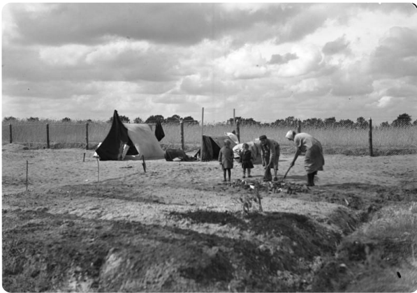
Berlin, Stadtrandsiedlung, Feldarbeit