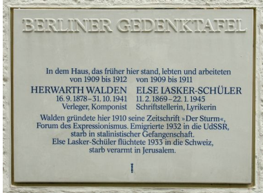
Eine Gedenktafel informiert den Leser und ist damit ein Sachtext.

① Beschreibe mit eigenen Worten, was ein Sachtext ist.