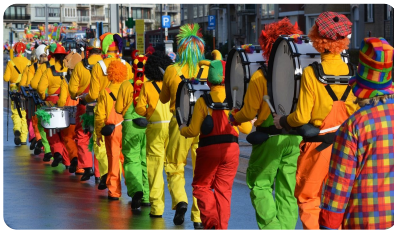
Abb. 4 — Karneval