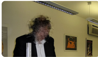
Abb. 5 — Person