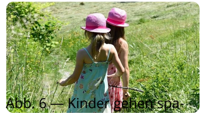
Abb. 6 — Kinder gehen spazieren