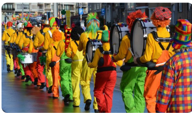
Abb. 4 — Karneval