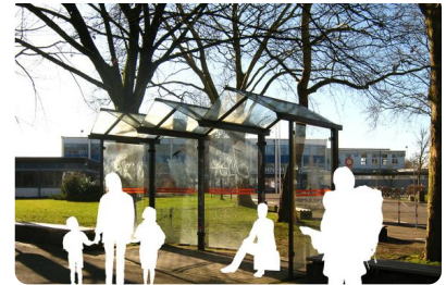
Abb. 3 — Bushaltestelle