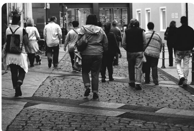
Abb. 7 — Straße