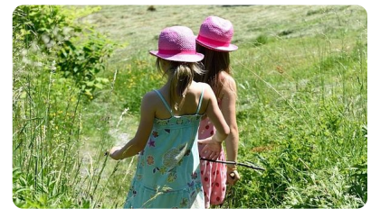
Abb. 6 — Kinder gehen spazieren