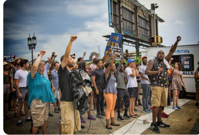
Abb. 2 — Protest