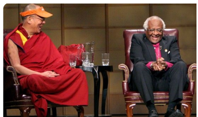
Abb. 8 — Dalai Lama