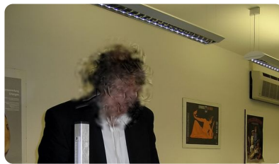
Abb. 5 — Person