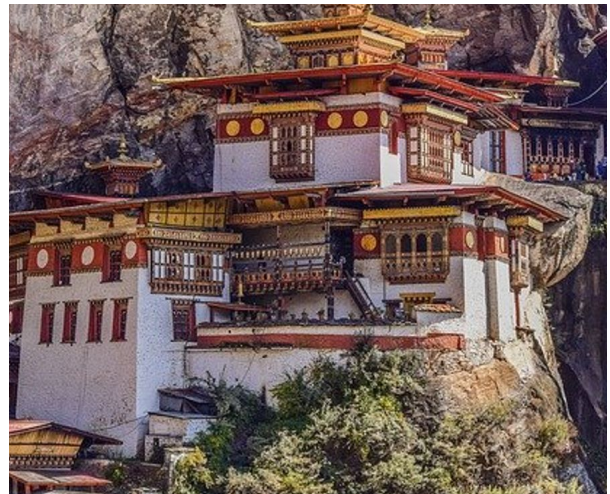
Tibet: ein buddhistischer Tempel

Weiteführende Informationen findest du unter folgender Adresse: