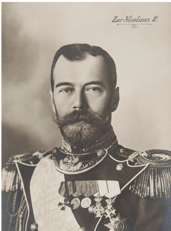
Zar Nicholas II