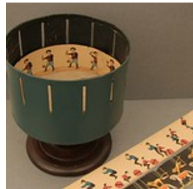
Zoetrop und Papierstreifen

https://www.experimentis.de/physikalisches_spielzeug/zoetrop/