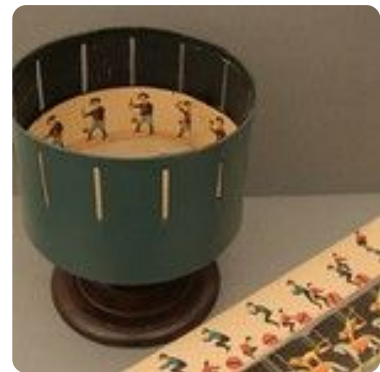
Zoetrop und Papierstreifen

https://www.experimentis.de/physikalisches_spielzeug/zoetrop/