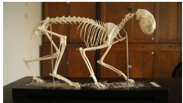
Abb. 2 - Skelett einer Hauskatze