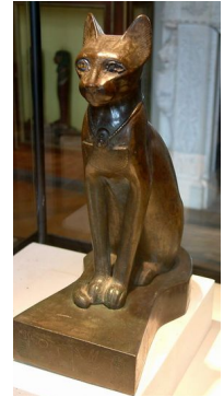
Abb.1 - Ägyptische Skulptur

Schon die Ägypter hielten Katzen als Haustiere. Aber auch in anderen Regionen der Erde leben Katzen schon lange gemeinsam mit den Menschen. Katzen wurden in einigen Teilen der Welt sogar verehrt.